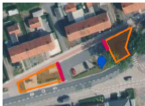
rode lijn => plaatsen rood-witte leggers op ooghoogte.

De werfzone dient op correcte wijze te worden afgesloten met herrashekkens. Er mag geen hinder zijn op het voet- en fietspad. Langs de kanten waar verkeer mogelijk is, dienen op ooghoogte rood-witte leggers te worden aangebracht. De hekkens dienen te worden voorzien van voldoende goedwerkende dagslapers.