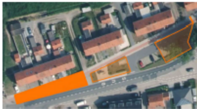
Werfzone huisnummer 107, 109, 111, 113 en 117

Het fietspad dient ter hoogte van de ronde te worden afgesloten met een werfhekken.