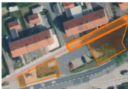
Werkzone huisnummer 91,93 en 95

Het fietspad en voetpad dienen ter hoogte van de ronde te worden afgesloten met een werfhekken. Het werfhekken dient te zijn voorzien van een wit-rode legger geplaatst op ooghoogte, een verbodsbord C3 en C19 evenals een aanwijzingsbord type F41 met een afbeelding van een voetganger en fietser, wijzende naar links. Voor de voetgangers dient er langs de Eeklostraat een veilige doorgang beschikbaar te blijven op het grasplein. Gezien de fietsers in de Eeklostraat zich dienen te begeven op de rijbaan, wordt de snelheid in de Eeklostraat tussen de rotonde en huisnummer 5 in beide rijrichtingen teruggebracht naar 30 km/uur (verbodsborden C43 "30"). Het verbodsbord C43 "30" dient in beide rijrichtingen voorbij het kruispunt Eeklostraat - Gr. M. d'Alcantaralaan te worden herhaald. De westelijke kant van de werfzone wordt eveneens door middel van werfhekkens afgesloten. Het werfhekken dient te zijn voorzien van een wit-rode legger geplaatst op ooghoogte, een verbodsbord C19 evenals een aanwijzingsbord type F41 met een afbeelding van een voetganger wijzende naar rechts.