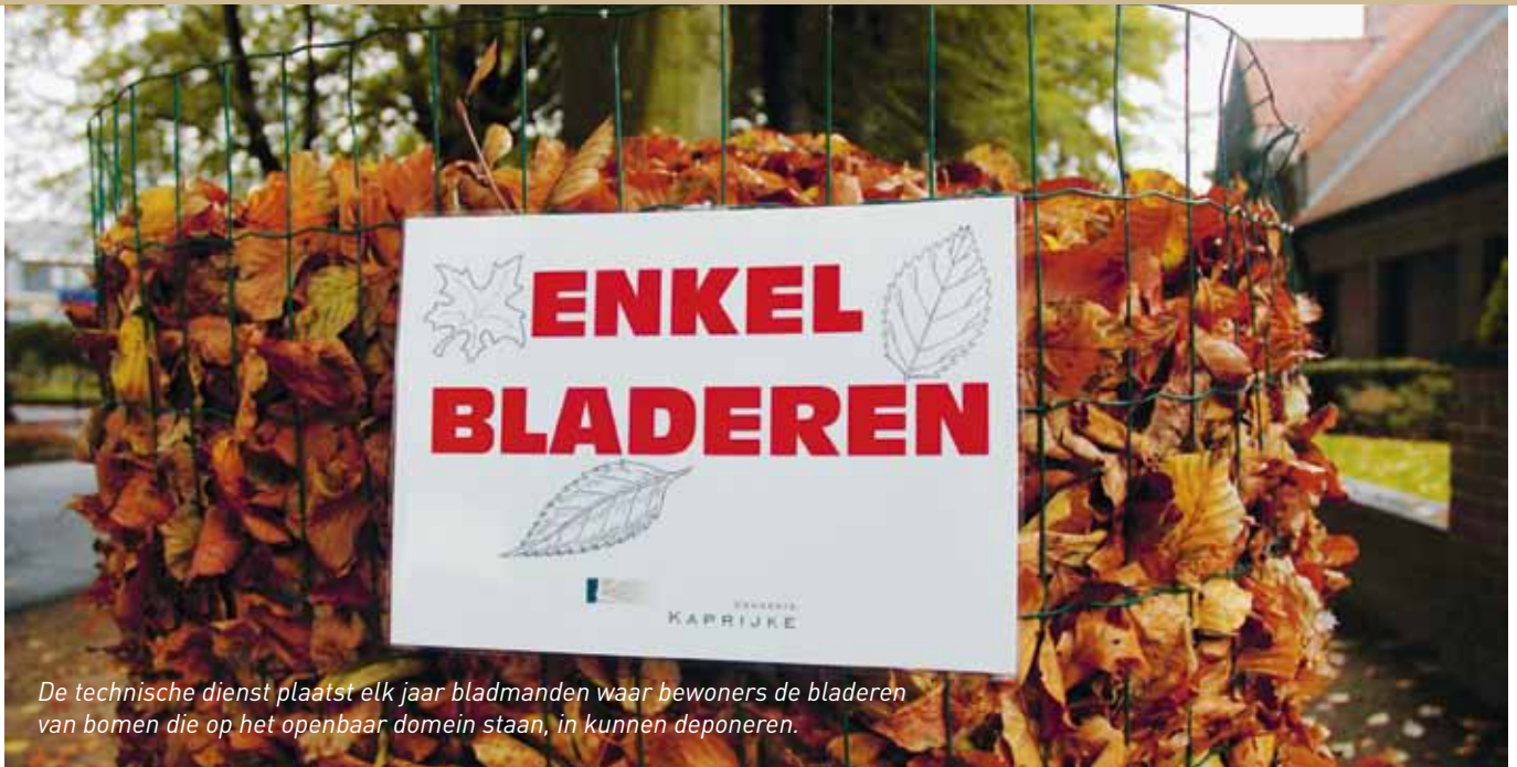
De technische dienst plaatst elk jaar bladmanden waar bewoners de bladeren van bomen die op het openbaar domein staan, in kunnen deponeren.