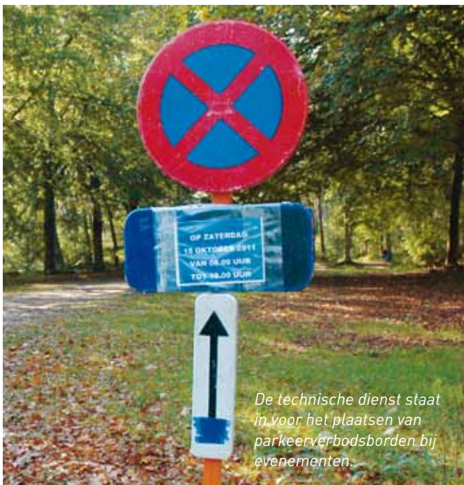
De technische dienst staat in voor het plaatsen van parkeerverbodsborden bij evenementen.