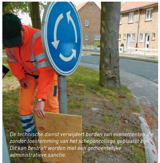
De technische dienst verwijdert borden van evenementen die zonder toestemming van het schepencollege geplaatst zijn. Dit kan bestraft worden met een gemeentelijke administratieve sanctie.